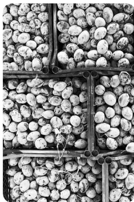
Площадь плодоносящих сливовых садов на Ставрополье составляет порядка 140 гектаров.

В текущем году в рамках краевой программы «Развитие сельского хозяйства» госпрограммы «Развитие сельского хозяйства и регулирование рынков сельскохозяйственной продукции, сырья и продовольствия» на поддержку садоводства на Ставрополье предусмотрено 293,3 млн рублей субсидий, в том числе из краевого бюджета – 27,25 млн рублей. В настоящий момент средства полностью доведены до сельхозтоваропроизводителей.